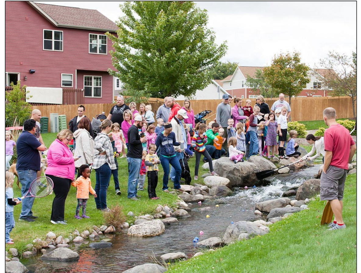
Secret Places Ducky Race and Stream Restoration