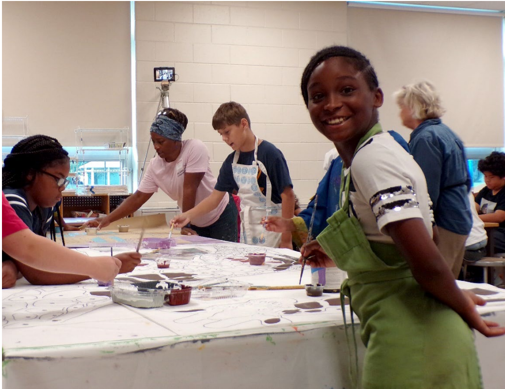
DAMA/Hawthorne E. Washington Tunnel Mural