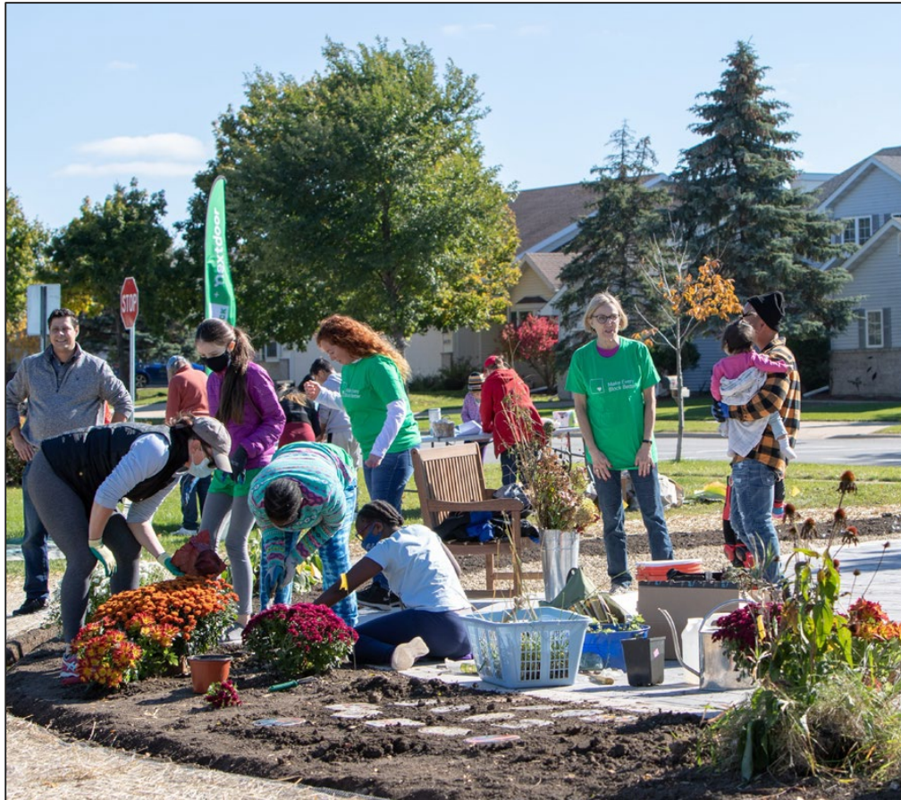
Junction Ridge Gathering Place and Celebration