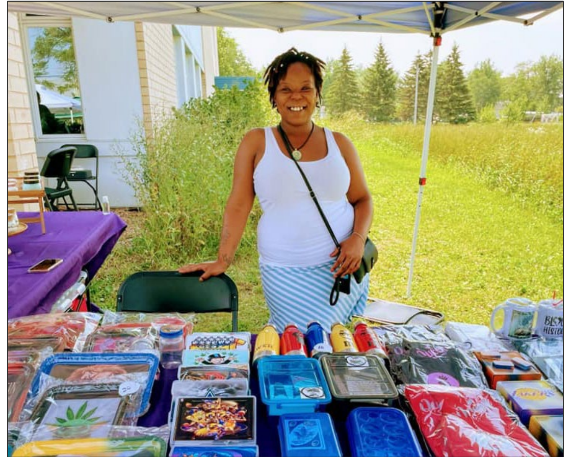
UJAMAA Business Association Membership