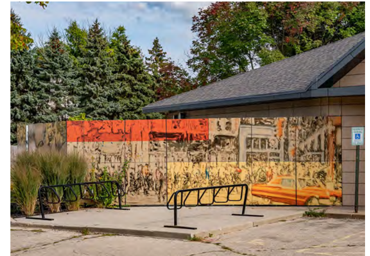
Hauj lwm ntawm Tus Kws Kos Duab yog tso saib rau ntawm Lub Chaw Ntiav Ua Hauj Lwm Southwest Madison Ntawm Urban League