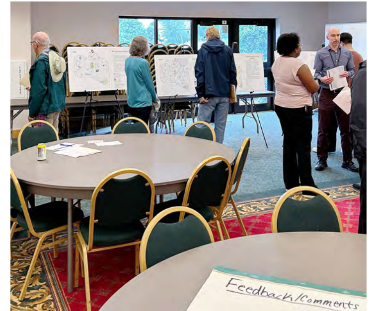
Lub koom txoos qhib tsev muaj nyob rau hauv xyoo 2024 los tham txog Daim Qauv Txoj Phiaj Xwm Thaj Tsam Sab Hnub Poob