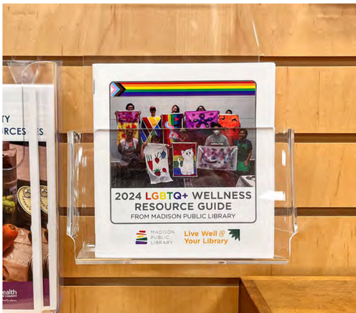
Phau Ntawv Qhia Cov Peev Txheej Kev Noj Qab Nyob Zoo Ntawm LGBTQ+ muaj nyob ntawm Txhua Lub Tsev Qiv Ntawv Rau Pej Xeeb Ntawm Madison, thiab Dream Bus