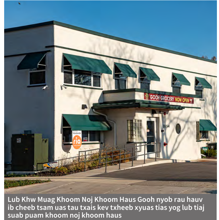
Lub Khw Muag Khoom Noj Khoom Haus Gooh nyob rau hauv ib cheeb tsam uas tau txais kev txheeb xyuas tias yog lub tiaj suab puam khoom noj khoom haus