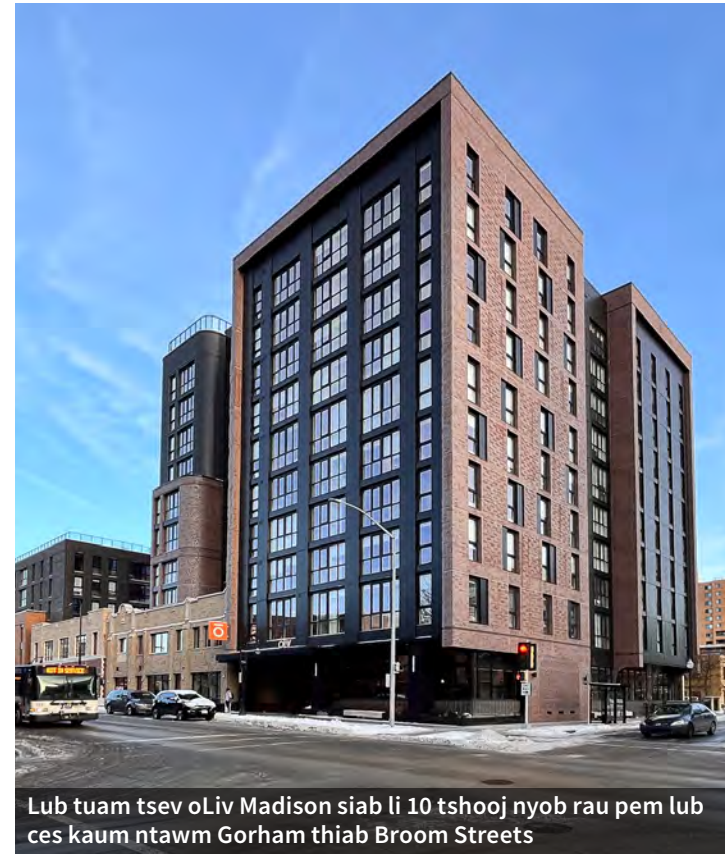
Lub tuam tsev oLiv Madison siab li 10 tshooj nyob rau pem lub ces kaum ntawm Gorham thiab Broom Streets