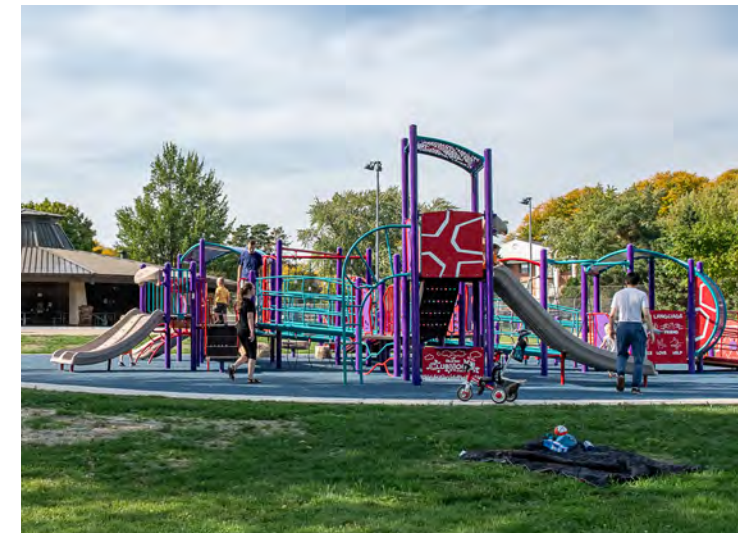
Qhov chaw ua si me nyuam yaus uas tuaj yeem nkag tau ntawm Rennebohm Park