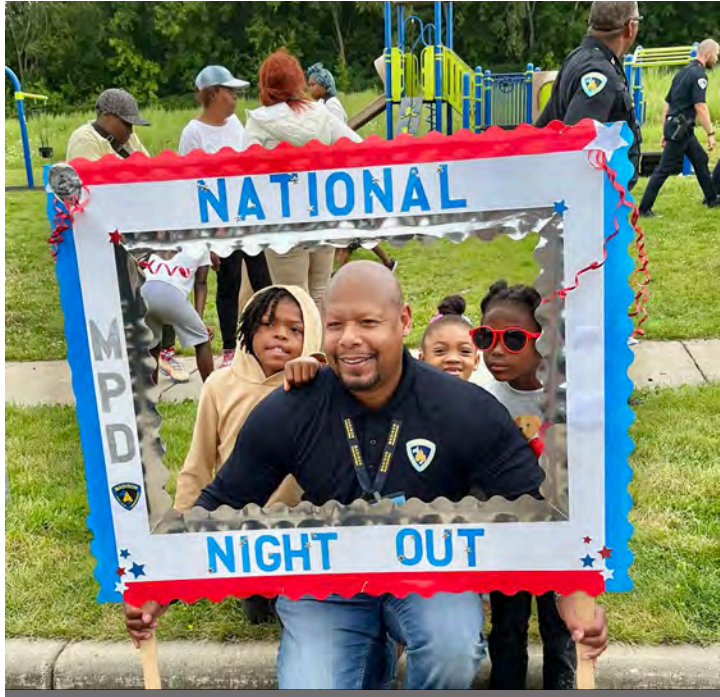
Cov Tub Ceev Xwm Madison koom nrog National Night Out