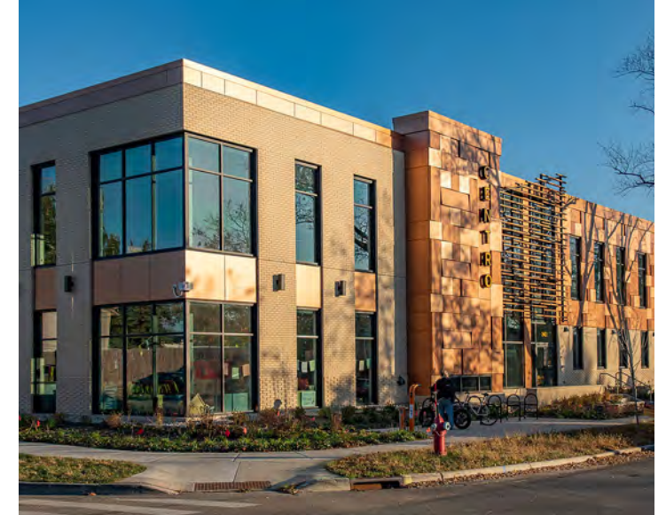
Lub chaw Centro Hispano tshiab ntawm Cypress Way