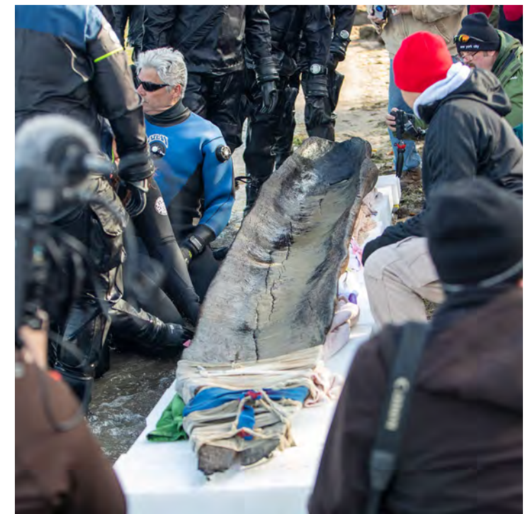
Tua nrhiav pom ib lub nkoj canoe qub rov qab los ntawm Lub Pas Dej Mendota