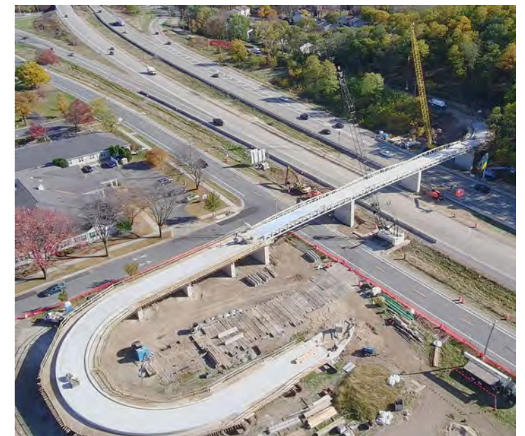
Madison txoj kev tshiab uas siv ntau tshaj plaws, Autumn Ridge, hla Xeev Txoj Kev Loj 30 ntawm Hiestand Woods