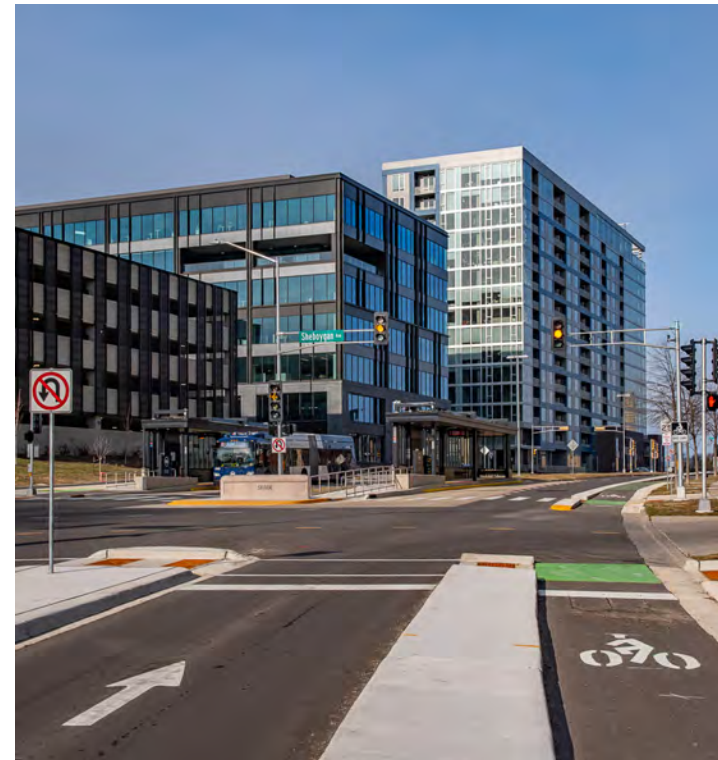
Txoj kev sib tshuam tshiab ntawm Sheboygan Avenue thiab Segoe Road