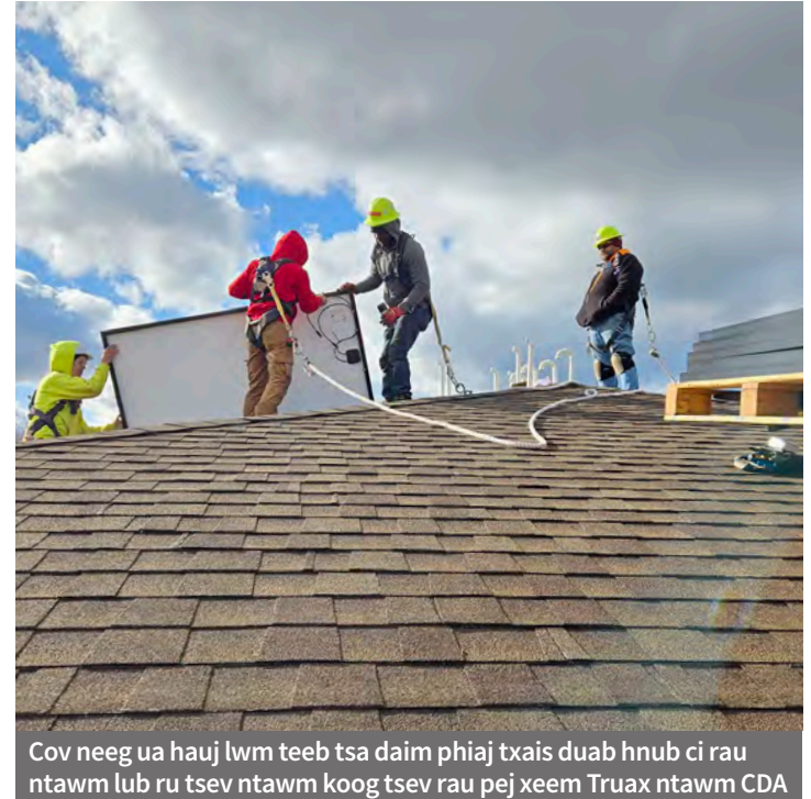
Cov neeg ua hauj lwm teeb tsa daim phiaj txais duab hnuab ci rau ntawm lub ru tsev ntawm koog tsev rau pej xeeb Truax ntawm CDA