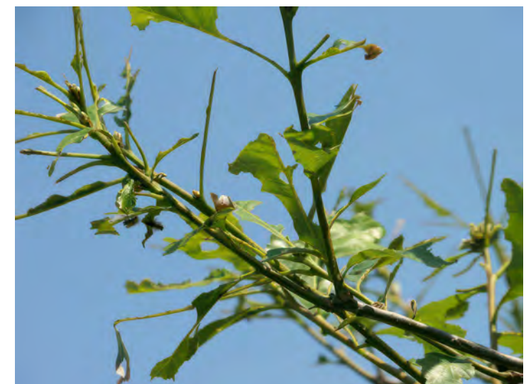
Cov nplooj uas tau txais kev puas tsuaj los ntawm cov npauj kab ntsig