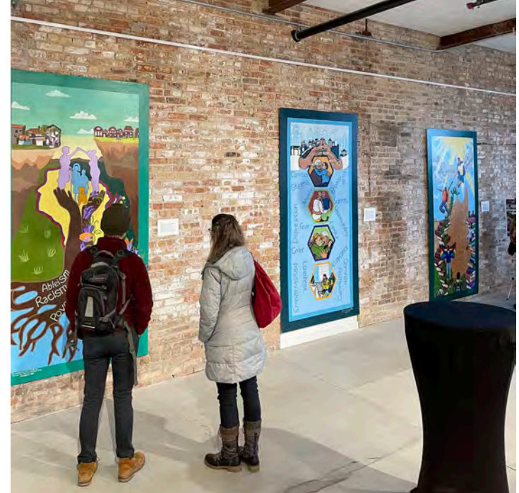
Txoj Phiaj Xwm Rau Kev Txhim Kho Kev Noj Qab Haus Huv Hauv Zej Zog muaj cov duab phab ntsa rau ntawm Garver Feed Mill