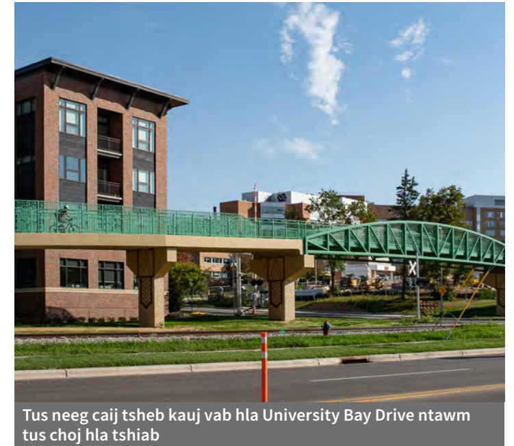
Tus neeg caij tsheb kauj vab hla University Bay Drive ntawm tus choj hla tshiab