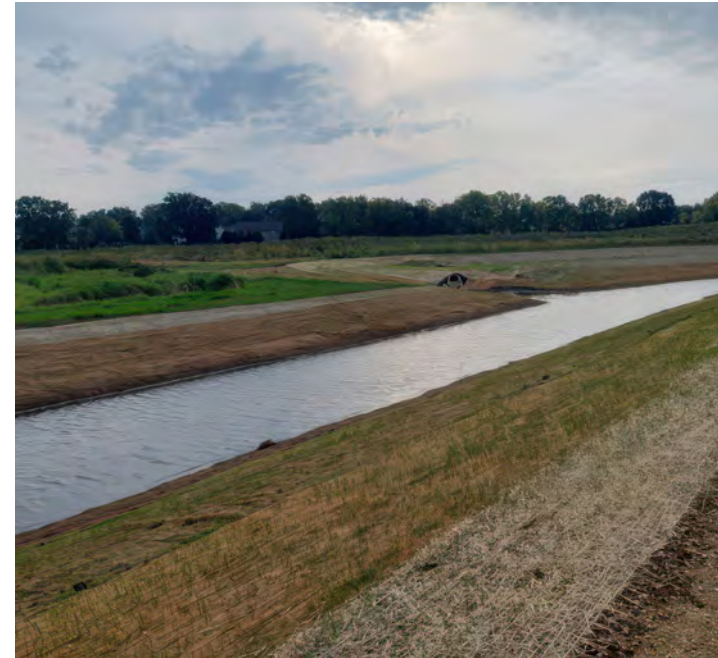
Kev tswj dej nag raws tus kwj deg Lower Badger Mill Creek