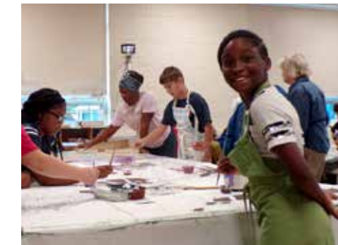
Mural del túnel Hawthorne/Truax E. Washington 2019