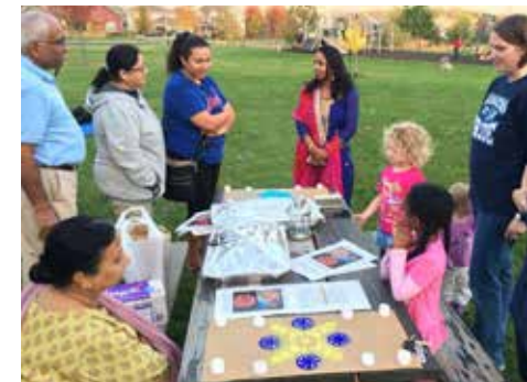
Celebración Secret Places Diwali 2017