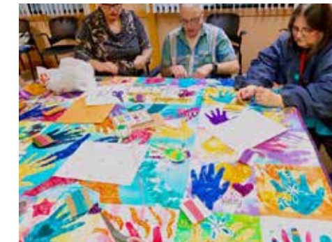
Colcha de Triangle Community 2019