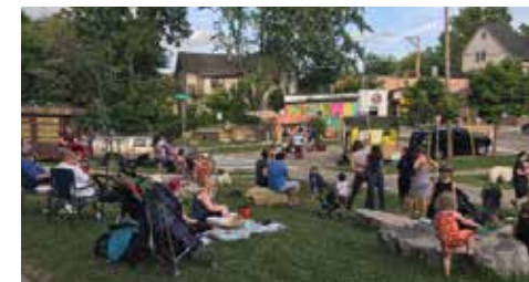
Lugar de reunión Schenk-Atwood-Starkweather-Yahara Jackson Plaza 2017

El Programa de subsidio a vecinos de la División de Planificación de la Ciudad de Madison ayuda a las zonas residenciales a embellecer las áreas de entrada, crear lugares públicos para reuniones o desarrollar la capacidad organizativa y las competencias de liderazgo. El programa de subsidio da el financiamiento, pero son las ideas, la determinación y el orgullo de los barrios los que están detrás de los proyectos más exitosos. En el 2020, la ciudad espera adjudicar alrededor en subsidios de $25,000.