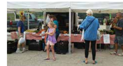
Aumentar la asequibilidad del Mercado de agricultores de Madison en Elver Park 2018