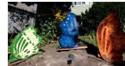
Sherman Yard Art 2015