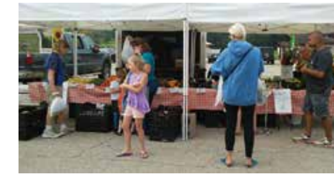
2018 Ua Kom Muaj Kev Them Taus Tus Nqi Ntawm Madison Khw Rau Neeg Ua Liaj Ua Teb ntawm Elver Park