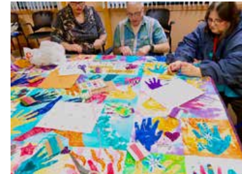
2019 Triangle Community Quilt