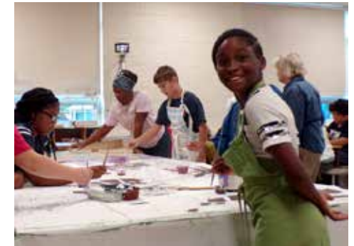
Hawthorne/Truax E 2019. Washington Tunnel Mural