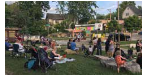
2017 Schenk-Atwood-Starkweather-Yahara Jackson Plaza Qhov Chaw Sib Sau Ua Ke

Feem Saib Xyuas Hauj Lwm Rau Nroog Madison Lub Laj Txheej Pab Cuam Nyiaj Pab Rau Koog Zej Zog pab cov koog zej zos kom muaj tej chaw tawm chaw nkag zoo nkauj, tsim cov chaw rau kev sib sau ua ke rau kev peev, los sis tsim kho peev xwm rau koom haum thiab kev paub kev ua tus coj. Lub laj txheej pab cuam nyiaj pab muab kev tawm peev tiam sis koog zej zog cov tswv yim, kev xam pom thiab kev zoo siab yog yam txhawb tom qab kom tau cov laj txheej pab uas muaj kev muaj yeej tau zoo tshaj plaws. Nyob rau xyoo 2020, Lub Nroog xav tau li ntawm $25,000 ua nyiaj pab.