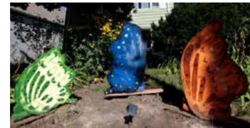
2015 Sherman Yard Art