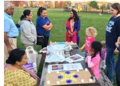
Cov Chaw Ua Koom Txoos 2017 Ntawm Diwali