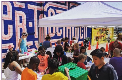
Planeación del Callejón de Murales