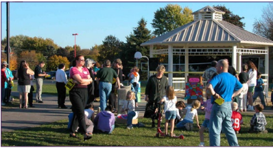
Kiosco de la Escuela Elemental de Hawthorne

La Ciudad usa los planes para vecindarios para revisar las propuestas de desarrollo y abordar los temas y necesidades identificadas durante el proceso de planeación tales como la seguridad para los peatones y los ciclistas, los sitios de reunión para la comunidad, los parques y espacios abiertos y otras necesidades. La comunidad también usa los planes, usualmente como una extensión de las relaciones creadas durante el proceso de planeación. A continuación le resumimos lo que los planes en el pasado han ayudado a alcanzar. Usted puede visitar la página web de la ciudad para ver cada uno de los planes de estos vecindarios en detalle: https://www.cityofmadison.com/dpced/planning/plans/440/ .