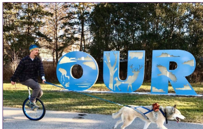
Artes Públicas a lo largo de Pennsylvania Ave.